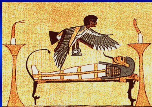
EGYPTIAN DRAWING OF THE ASTRAL BODY LEAVING THE PHYSICAL BODY AT DEATH

Efter en viss tid i kama-loka fortsätter detta attributkonglomerat att verka och håller det reinkarnerade egot fångslat genom sin dragning till det jordiska, medan den personliga människan är medvetlös. Detta tillstånd varar tills den andra döden inträffar, vilket helt enkelt betyder att den stund har kommit när det mänskliga egot har lyckats bryta varje länk med den dragningskraft som förenar det med dess personliga kama-rupa. Den andra döden är således den astrala motsvarigheten till det som ägde rum vid den fysiska döden.[12]